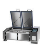
JUMP 101 DS ▾