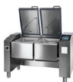
JUMP 101 DM ▾