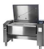
JUMP 151 JUMP 151 F ▾