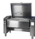
JUMP 151 P ▾