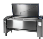
JUMP 201 JUMP 201 F JUMP 251 ▾